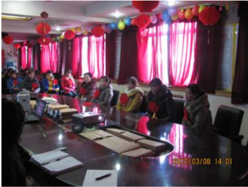
图4-8：社会公益、企业文化